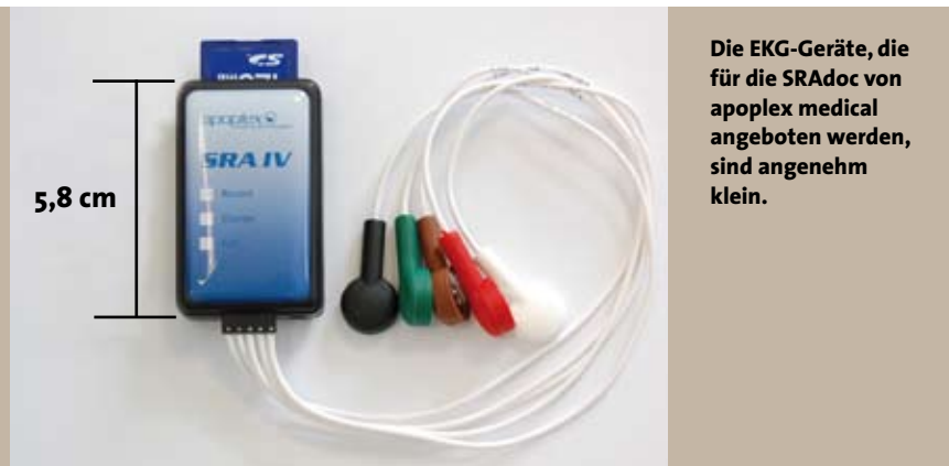
Die EKG-Geräte, die für die SRAdoc von apoplex medical angeboten werden, sind angenehm klein.

Der Versorgungsvertrag beleuchtet einen wichtigen Teil der Schlaganfallprävention. Der Integrationsgrad, die „Flächendeckung“ und die Möglichkeit der wissenschaftlichen Evaluation der Präventionseffekte sind Ausdruck eines seriösen Vertragskonzeptes. Aufgrund der hohen versorgungspolitischen Bedeutung wirksamer Schlaganfallprävention sind wir froh, dass wir als Neurologen über die Cortex Management GmbH an diesem Vertrag partizipieren und wünschen uns eine hohe Beteiligung unserer Fachgruppe. Gleichwohl ist uns klar, dass wir mit diesem Vertragsgegenstand zunächst nur einen Teilbereich der Schlaganfallprävention regeln. Derzeit verhandeln wir eine Ausweitung des Vertrages mit Einbeziehung von Edukationsprogrammen. □